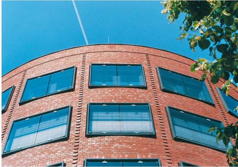
Ausschnitt aus der gerundeten Fassade mit hervorgezogenen Klinkerköpfen in reihenförmiger (linsenartig) Anordnung